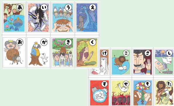
A 4の紙1枚に8つの絵札 (6枚)