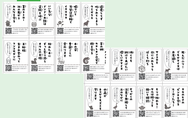
A 4の紙1枚に8つの読み札 (6枚)